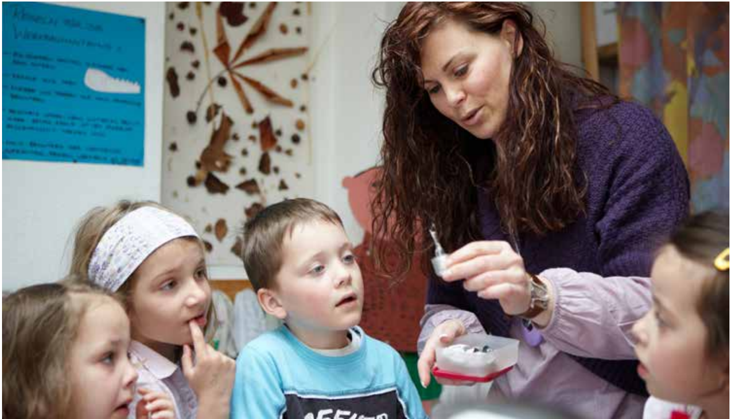
Bildung für nachhaltige Entwicklung in der Praxis: Die Erzieherin geht mit ihren Kita-Kindern Fragen zu Energie und Umwelt auf den Grund.

für ökologische, soziale und ökonomische Prozesse diskutiert werden können (BMBF 2009: 6f.). Diese Themen sind zudem anschlussfähig an den Alltag der Menschen.