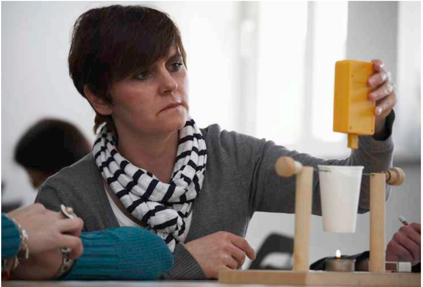
Experiment in der Lernwerkstatt: Eine Teilnehmerin testet die Eigenschaften von Wärme und ihrer Leitfähigkeit aus.

ge zum Thema zu ermöglichen. Diese Grundhaltung trägt dazu bei, dass sich die Anbieter von Fortbildungsveranstaltungen für Multiplikatoren als „Lernmoderatoren“ begreifen und diese Einstellung durch die Gestaltung des Bildungsprozesses weitergeben.